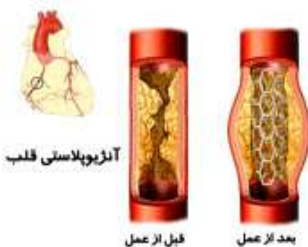
قبل از عمل

ممکن است افراد دچار انسداد در سرخرگ های قلبی، چنانچه احساس ناراحتی زیادی در قفسه سینه کنند یا انسداد سرخرگ های قلبی آنها را در معرض خطر حمله قلبی یا مرگ قرار بدهد، نیاز به آنژیوپلاستی پیدا کنند. سالانه افراد بسیار بیشتری تحت آنژیوگرافی و آنژیوپلاستی کرونری قرار می گیرند.